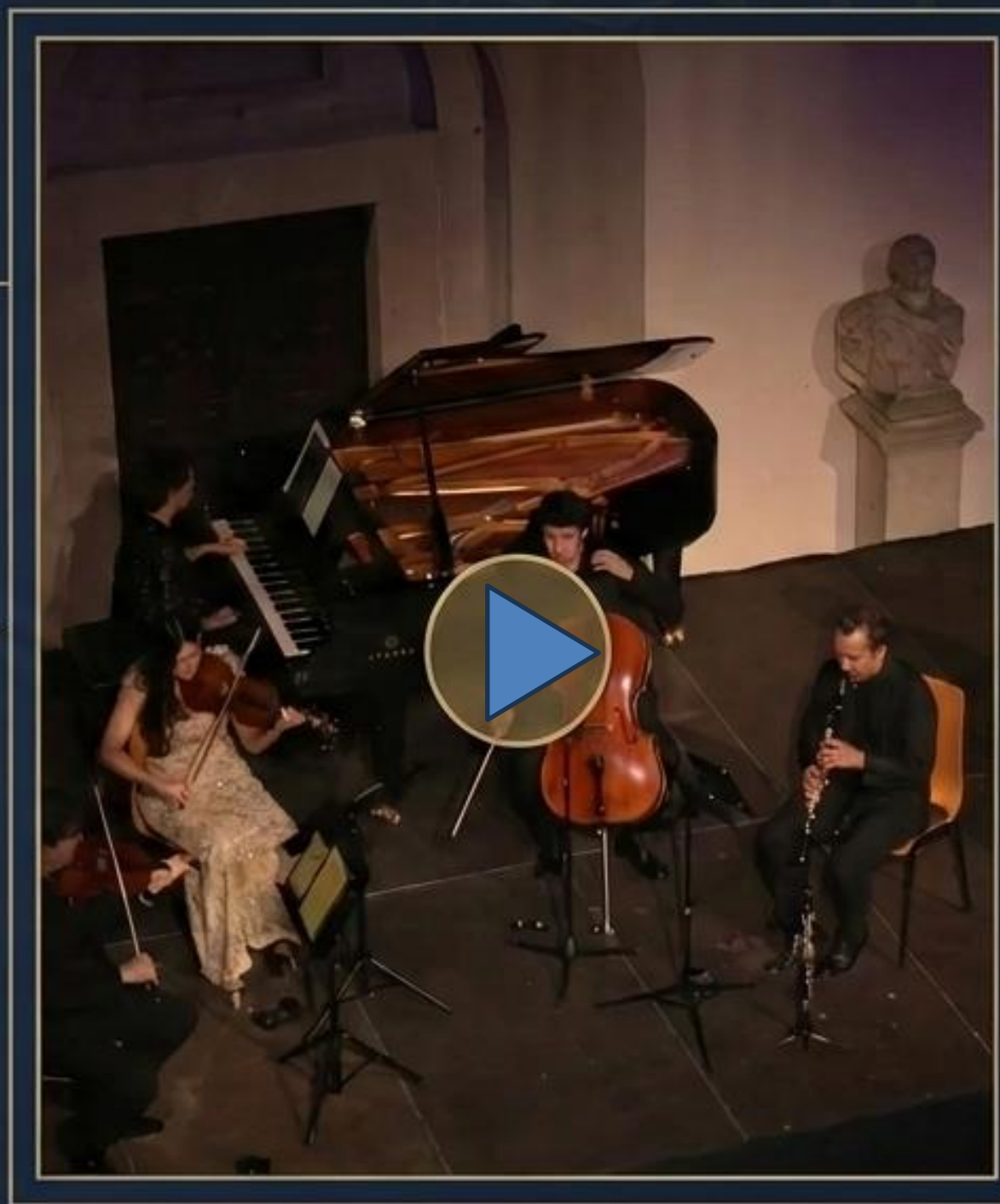
Actuación en directo de la Camerata Da Vinci (Festival MUSEG, Alcázar de Segovia, 2025).

Este concierto nos transporta a los lugares lejanos donde los genios surgen de las lámparas, los pájaros hablan y los barcos navegan por mares de tempestades. Una inmersión total en Oriente, donde la música cobra vida para contar la historia de la heroína Scheherazade y el poder salvador de la palabra.